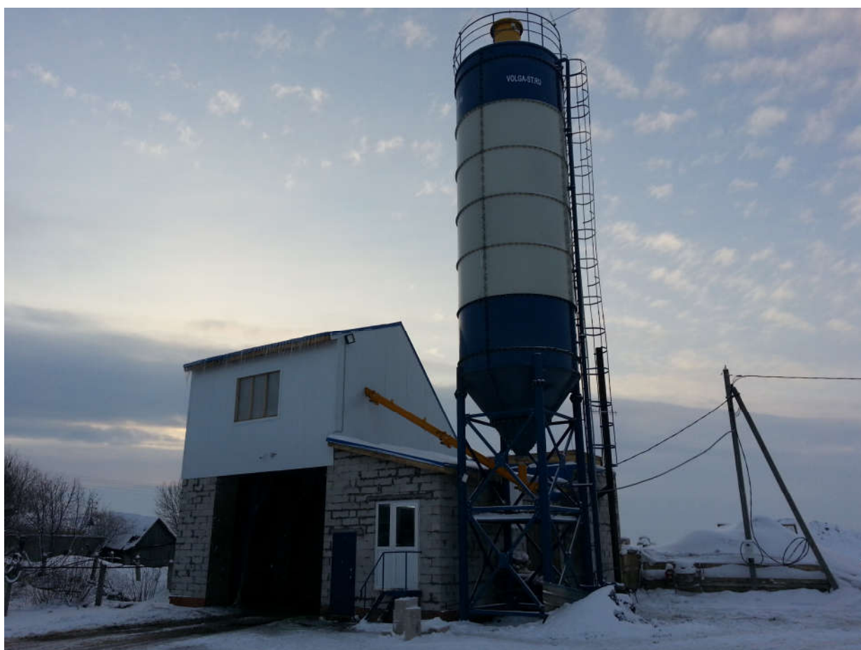
Фото БСУпа-35h-ск (в зимнем исполнении)